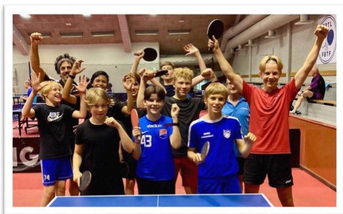
MBF:n junioriharjoitukset elokuussa 2022